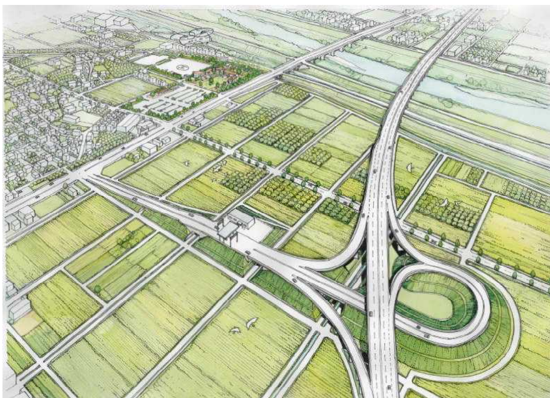
「東海環状自動車道（仮称）大野・神戸ICイメージ」