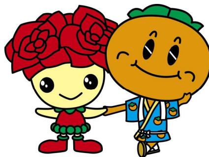
“ローズちゃん パーシーちゃん”