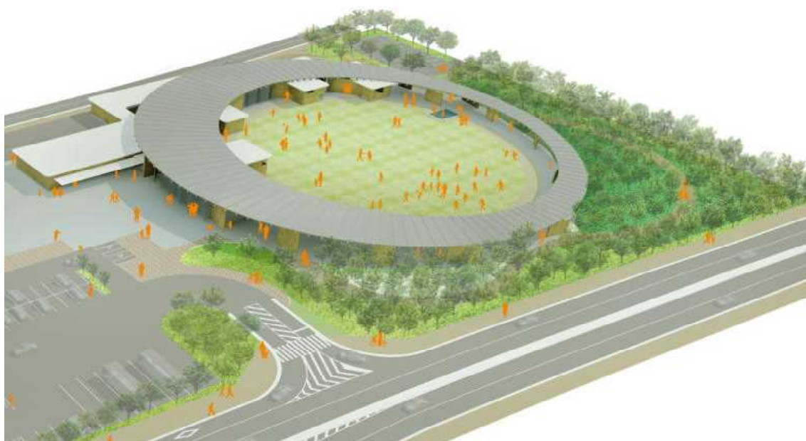
【道の駅「(仮称)大野」完成イメージ】