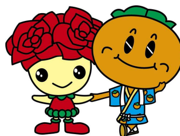
“ローズちゃん パーシーちゃん”