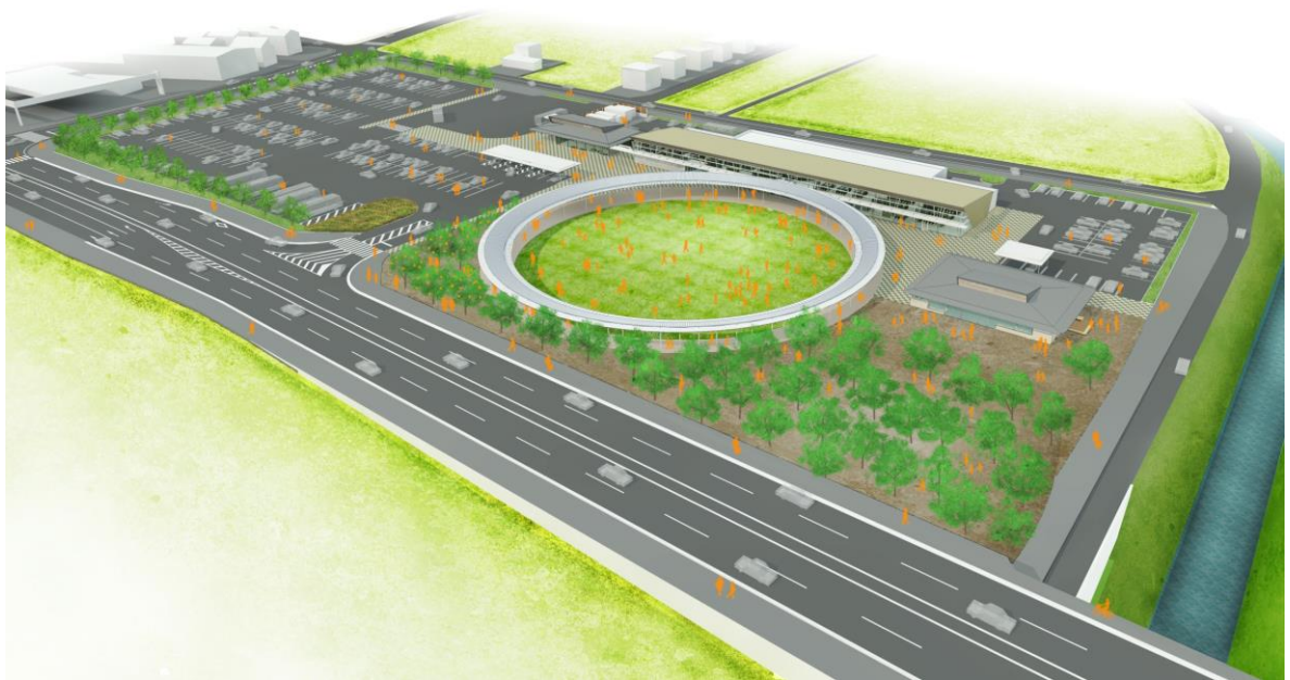
道の駅「パレットピアおおの」完成イメージ