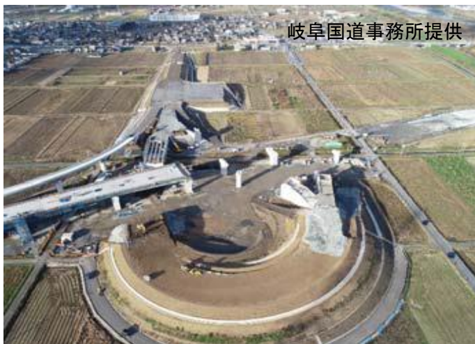
(仮称)大野・神戸インターチェンジ