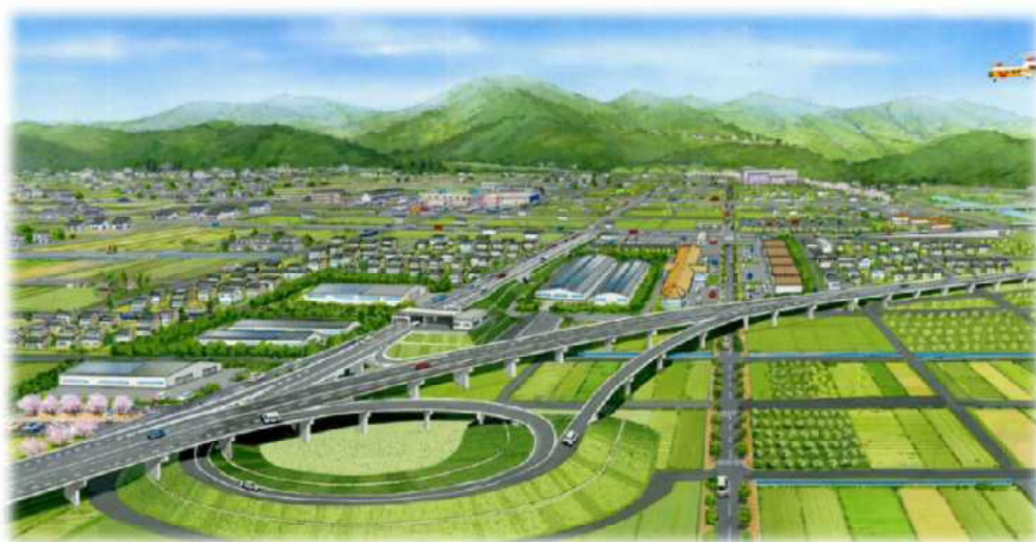
「東海環状自動車道（仮称）大野・神戸ICイメージ」