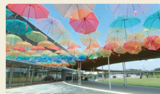
道の駅「バレットピアおおの」

岐阜県最大級の道の駅です。観光情報を発信するほか、農産物直売所、レストラン、ペーカリーも完備しています。