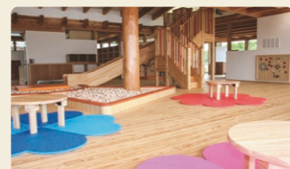
子育てはうすばすてる

岐阜県最大級の道の駅です。観光情報を発信するほか、農産物直売所、レストラン、ペーカリーも完備しています。