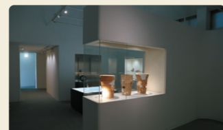
大野あけぼのミュージアム

5,000人を収容できる野球場(弘光舎レインボースタジアム)、多目的運動場(マイブルグラウンド)などがあり、体育文化の拠点となっています。