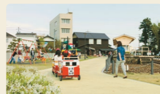
黒野駅レールパーク(黒野駅ミュージアム)

約150種類、2,000株のバラが園内を彩ります。見頃は5月と10月です。毎年5月にはイベントも開催されます。