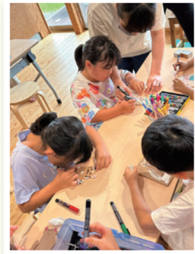
▲スタンド立て制作の様子 (木工コース)