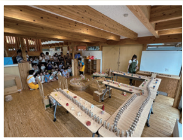
▲オープニングの様子

8月6日に、『夏休みワークショップ』を開催しました。オープニングでは「ばすてる」のおもちゃを使ったピタゴラスイッチを行い、その後「工作コース」と「木工コース」の2コースに分かれて行いました。「工作コース」では、「はらぺこあおむし」を題材にした工作を行い、「木工コース」では糸のこを使った「スタンド立て」を制作しました。それぞれ思い思いの作品を制作し、出来上がった作品を見て嬉しそうにしています。親子で楽しめる時間を過ごすことができました。