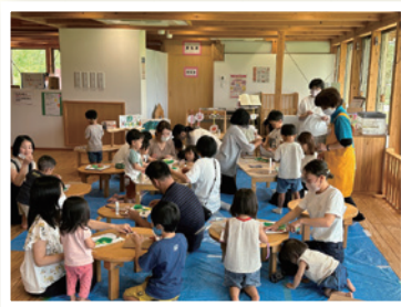
▲はらぺこあおむしの工作の様子 (工作コース)