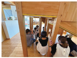
▲防災体験のようす

実際に地震を想定して防災体験をしました。2歳児のクラスでは新聞紙でスリッパをつくり、新聞紙のスリッパを履いて歩いてみました。子どもたちだけではなく、お母さんたちも防災についての知識を再確認していました。