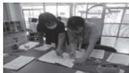
▲読書感想文審査会