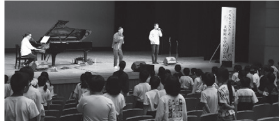
▲アルケミストとの音楽教室の様子

子どもたちの心には、未来の自分に向けた「がんばれ！」のタイムカプセルが埋め込まれ、会場は子どもたちの笑顔と感動に包まれました。