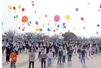
▲「がんばれ」と一斉にバルーンリリースをする子どもたち