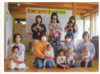
▲ピヨピヨクラブふたば （0歳児）クラス

希望される人は9月1日（金）までに「子育てはうす ぱすてる」に 申込書を提出してください。＊電話受付不可。