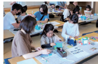
▲牛乳パックカー作り

問合せ先 おおのファミリー・サポート・センター（子育てはうす ぱすてる内） ☎ 34-1010