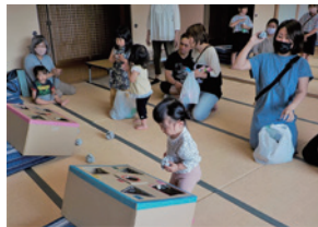
▲新聞ボール入れゲーム

次回の交流会は、8月27日（日）に人形劇やゲーム、ダンスなどを予定していますので、皆さんの参加をお待ちしています。