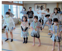
▲新聞紙でフラダンス