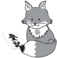
不動産登記推進イメージキャラクター「トウキツネ」

詳しくは『あなたと家族をつなぐ相続登記』で検索するか、または次の二次元コードからアクセスし、確認してください。