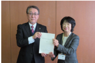
▲原委員長（左）から答申書を受取る教育長

委員会では、町立小中学校の現状や今後の児童生徒数の推計などを踏まえ、令和4年に実施した学校規模適正化についてのアンケート結果や、子ども未来シンポジウムなどの意見を参考に、大野町の子