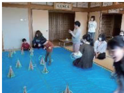
▲前回の交流会の様子