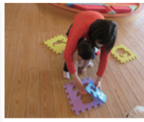
▲パズルあそびの様子 (みつばクラス)