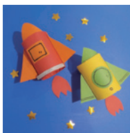
▲空飛ぶロケットを作ろう