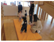
▲おさんぽあそびの様子 (ふたばクラス)

新年度からは新たなピヨピヨクラブが始まります。これからも親子で楽しく過ごせる時間を作っていきたいと思えます。