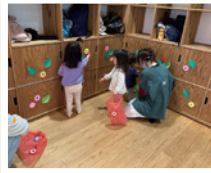
▲ふれあいあそびの様子 (よつばクラス)