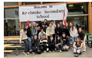
▲ホストファミリーとの記念撮影の様子

も伝えようとする思いで気持ちが通じ合えた。学ぶ姿勢や分かり合おうとする姿勢をこれからの生活に活かしたい」と報告しました。生徒ら全員が感想や今後の抱負を力強く発表すると、町長が「大野町とカナダの素晴らしい架け橋ができた。世界に羽ばたける人になってほしい」とエールを送りました。