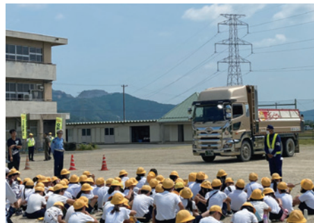
▲交通安全教室の様子

グラウンドでダンプカーが左折し、前輪よりも後輪が内側を通ることを学びました。また、実際に児童がダンプカー前や左右に立ち、運転席からの死角となる見えない場所が広範囲に及ぶことを観察し、交通安全への意識を高めていました。