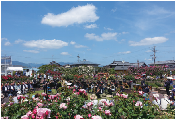
▲岐阜商吹奏楽部による演奏