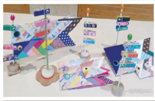
▲かわいい鯉のぼりがいっぱい

「鯉のぼりクリップ」の製作を行い、それぞれとても工夫を凝らした力作が並びました。多くの親子に参加いただき、交流を深める時間になったと思います。