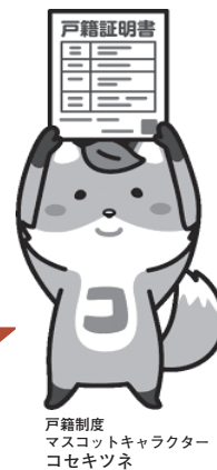
戸籍制度 マスコットキャラクター コセキツネ