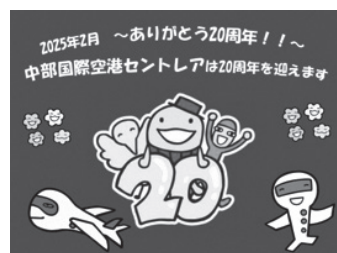
開港20周年ロゴマーク

中部国際空港（セントレア）開港20周年、誠にありがとうございます。今後も相互の交流を深めるとともに、益々のご発展を心よりご祈念いたします。