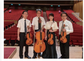
▲パレット弦楽四重奏の皆さん