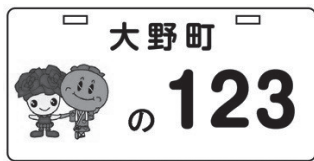
▲ご当地ナンバーデザイン