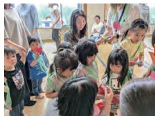
▲お店屋さん「いらっしやい」

交流会(お楽しみ会)では、音楽コンサートやミニ運動会、廃材を使った制作、絵本の読み聞かせなど、毎回楽しい企画を行っています。