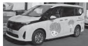
ワンボックス車両