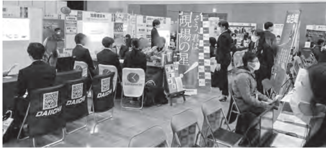
▲昨年度「オール岐阜・企業フェス」の様子

県内企業約200社が集う県下最大級の合同企業展「オール岐阜・企業フェス」を開催します。ぜひ参加ください！