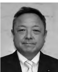
久保田 かずしげ 議員

A 車止めの鍵については道路管理者である町、町防災担当である総務課、当該地区の区長、揖斐郡消防組合において保管しています。また解錠の手順を含めた管理マニュアルについては、地域防災計画へ反映させた後、必要に応じ策定を検討してまいります。