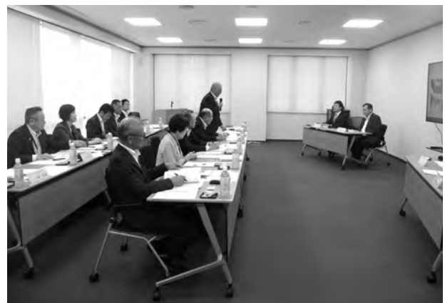
▲大津町役場で議会 B C P の取組みについて学ぶ議員

このような事が行政視察を終えて再確認したことであり、今後のまちづくりに生かしていきたいと願いつつ、報告とします。