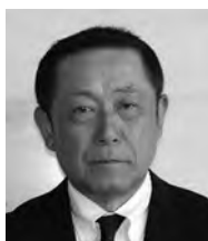
長沼 健治郎 議員

柿研修センターのシステム構築に向けて、関係機関と連携して取り組むとともに、予算の拡充や新たな補助についても検討してまいります。