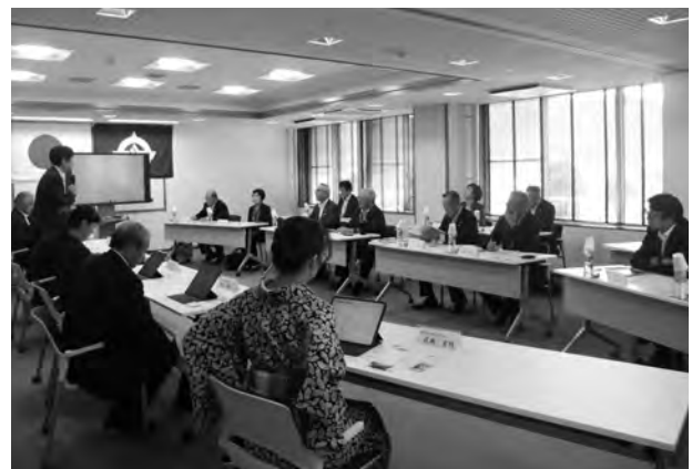
▲御船町役場で議会のデジタル化について学ぶ議員