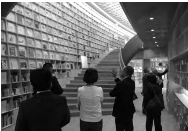
▲「こども本の森 熊本」にて