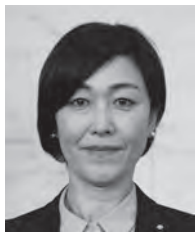
宇佐美 みやこ 議員