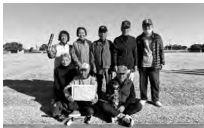
▲西濃地区軽スポーツ大会クロッケーの部 優勝 上磯

地区ふれあいセンター単位でグラウンドゴルフ等の軽スポーツ大会の開催、地域貢献活動（花壇への植栽や児童の登下校の見守り活動、地域の清掃活動）を実施しています。