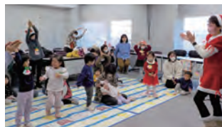
▲音楽に合わせてダンス♪

問合せ先 おおのファミリー・サポート・センター(子育てはうす ぱすてる内) ☎ 34-1010