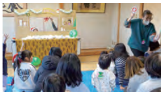
▲クイズ「窓からなあに?」

会員の皆さんが安心してファミサポを利用いただけるよう、今後も交流会を行っていきますので、皆さんの参加をお待ちしています。