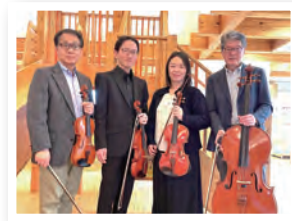
▲パレット弦楽四重奏の皆さん

プログラム となりのトトロ、おもちゃのシンフォニー(参加者と合奏)ほか 演奏者 パレット弦楽四重奏(大垣市室内管弦楽団のメンバー) 日時 3月1日(日)午後2時~(開場:午後1時45分)(1時間程度) 定員 50人(親子あわせて) 参加費 200円(小学生以上)※町外の20歳以上は別途入館料100円 申込方法 参加者氏名、年齢、住所、連絡先を「子育てはうすぱすてる」まで申込む。(電話予約可) 申込締切 2月23日(月・祝) ※定員になり次第、締切。