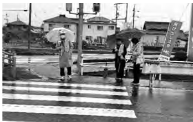
▲児童の登下校の見守り活動