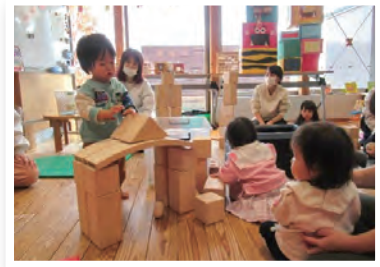
▲ピヨピヨクラブひよこ組

2月、ピヨピヨクラブひよこ組は「つみばぼバーン」「イブブロック」「ズレンガ」等の木のおもちゃを使って親子で楽しむことができました。こどもたちは一つひとつ積み木を積みあげて「できたー!」と満面の笑みで、お母さんとハイタッチ!微笑ましい親子の姿や、集中して遊ぶこどもたちの可愛い姿が見られました。遊びを通して五感で感じながら楽しく過ごしました。ぱすてるには「もりのカラカラおむすび」「tumoka」等のおもちゃもあり大好評です。ぜひ遊びにきてください。