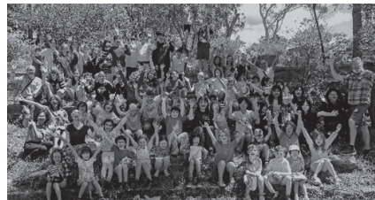
▲現地学校での集合写真