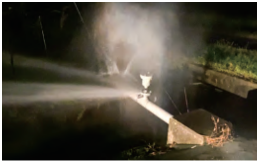
▲水管橋が漏水している様子