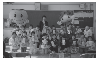
▲北小学校での入学準備祝金贈呈のようす

今年は1月末から2月中旬にかけて行われた各小学校の入学説明会において、新1年生の児童に商品券をお渡ししました。2月2日に北小学校で行われた説明会には、パーシーちゃん・ローズちゃんも参加し、楽しい学校生活を送ってと、こども達にエールが送られました。