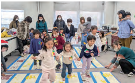
▲前回のクリスマス交流会の様子

おおのファミリー・サポート・センター (ファミサポ) では「子育てを応援する会員同士が支え合う事業」を皆さんにもっと身近に感じてもらい利用していただけるよう、交流会を年3回ほど開催しています。