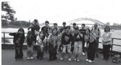
▲シドニー市内訪問時の集合写真

今回の派遣は、生徒一人ひとりにとって、外国への理解を深め、国際的な感覚を養う貴重な機会となりました。今回得た学びや挑戦する姿勢を、ぜひ学校の仲間たちにも伝え、今後さまざまな場面で活かしてくれることを期待しています。