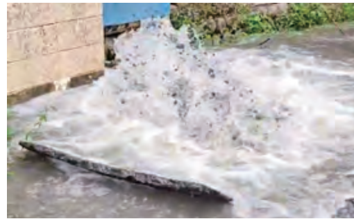
▲漏水により道路が陥没した様子