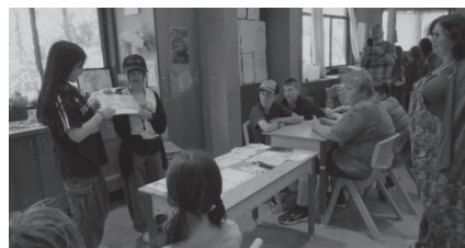
▲文化交流会の様子