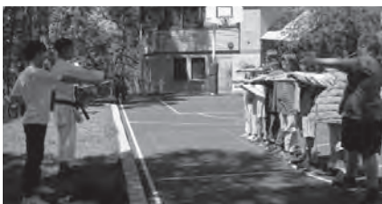
▲文化交流会の様子