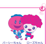
パーシーちゃん ローズちゃん