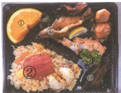
※川の駅旬の味 おか多さん